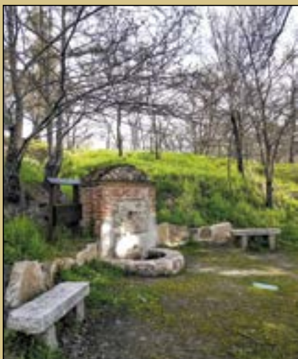
Fotografía de portada: Fuente Albertus 'El Forestal Ana Martín Padellano Marzo 2026