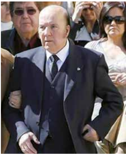
Desgarradora imagen de Chiquito de la Calzada en el entierro de su esposa.

rostro con la serenidad cérica, inmovible, inexpresiva, hasta solemne, que sucede al tránsito, gritaba desolado y quería ser enterrado con ella.