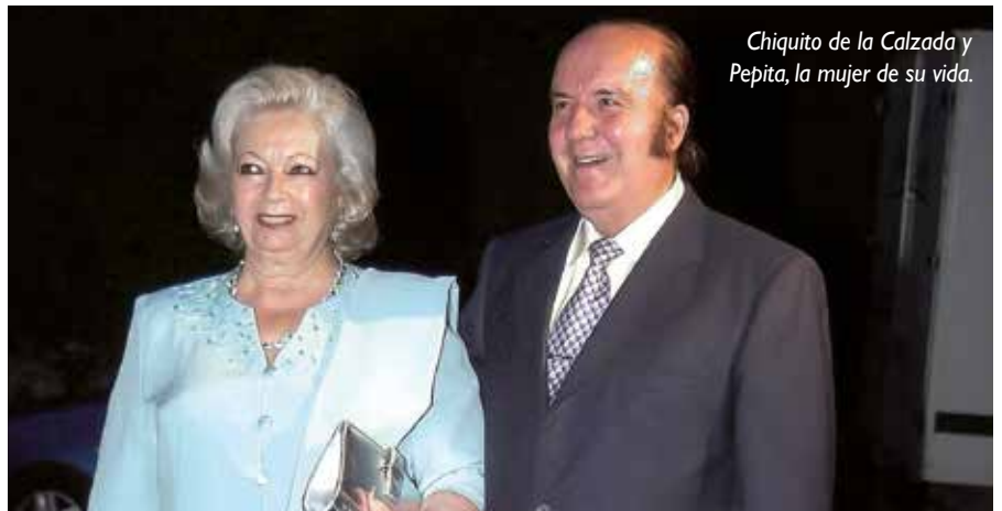
Chiquito de la Calzada y Pepita, la mujer de su vida.

En su vida lloró Chiquito de la Calzada con tanta pena, rodeado de algunos amigos y familiares que ya habían conocido la noticia de lo ocurrido. ¿Cómo era posible que en un segundo se quebrara para siempre la vida de una persona? ¿Y que esa persona fuera precisamente Pepita que no había dado señales de padecer ninguna dolencia? Gregorio, entre lágrimas, se hacía las preguntas incontestables que nos hacemos todos en momentos semejantes. No podía creerse la desgracia que le había tocado vivir, pero cuando la realidad se imponía al acariciar las manos frías de Pepita y ver su