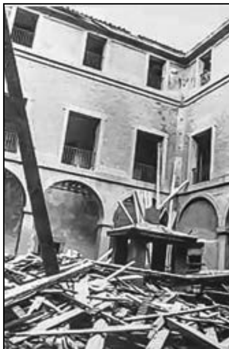
Estado del patio herreriano antes de su última reconstrucción en 1973