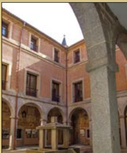
Fotografía de portada:

Patio Herreriano Castillo de Villaviciosa de Odón. Ana Martín Padellano 2018